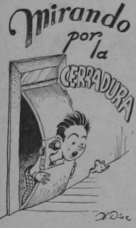
UNA FRASE QUE REVELA NUESTRA REALIDAD

Sigue en el debate el extraordinario asunto Tacho Somoza. Para los nicas ahora se trata de dos Somozas: el padre y el cachorro, un cachorro que se graduó en West-point. Para nosotros los ticos se trata de un sólo Somoza, el que tiene relaciones ganaderas con un trust de políticos nuestros que no se sabe si son comunistas, o si son cristianos o si son demócratas o si son solamente negociantes con patente de hombres públicos. El hecho es, que en torno a ellos gira todo ese tachismo que es fundamental para el negocio del ganado y para la perduración del Régimen.